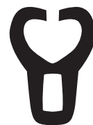
HEMSLÖJDEN I ÖSTERGÖTLAND